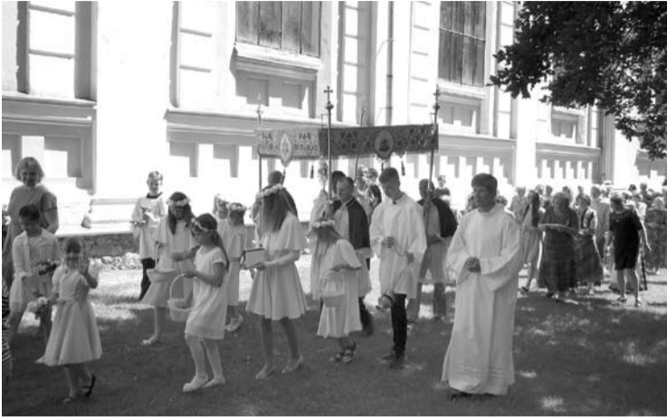
Iškilminga procesija aplink Kavarsko Šv. Jono Krikštytojo bažnyčią vyko birželio 24 dieną.