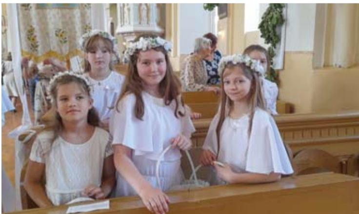
Mergaitės barstė gėlytes per procesiją.

Renginio dalyviai ėjo „pašpaciuruoti“ betoniniu šaligatviu,