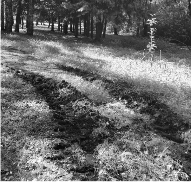
Šitaip nupjauta žolė Anykščių miesto parke papiktino anykštėnę.

Tuo tarpu Anykščių komunalinio ūkio direktorius Kęstutis Šapoka teigė, jog pieva šienaujant buvo sugadinta dėl stipraus lietaus.