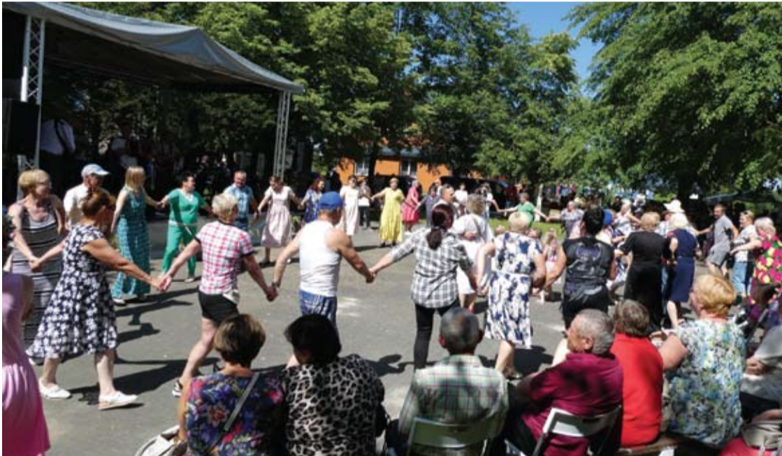
Smagus kapelų koncertas išjudino žiūrovus.