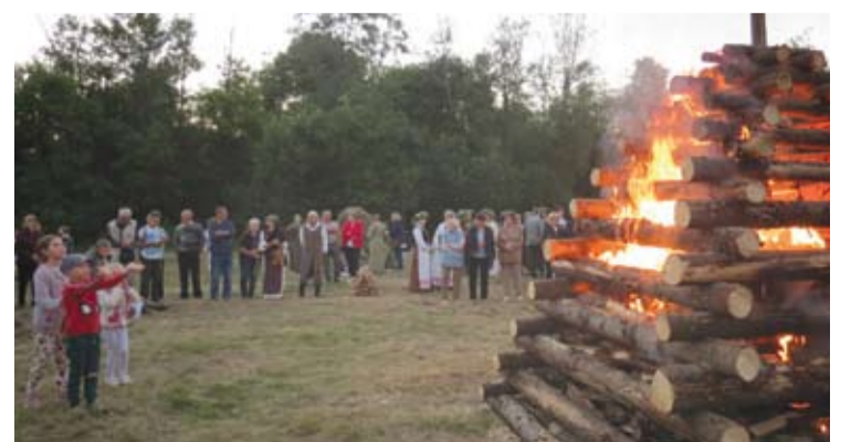
Joninių laužą sukrovė Kavarsko seniūnijos darbuotojai, o medieną padovanojo Valstybinių miškų urėdijos Anykščių regioninis padalinys.