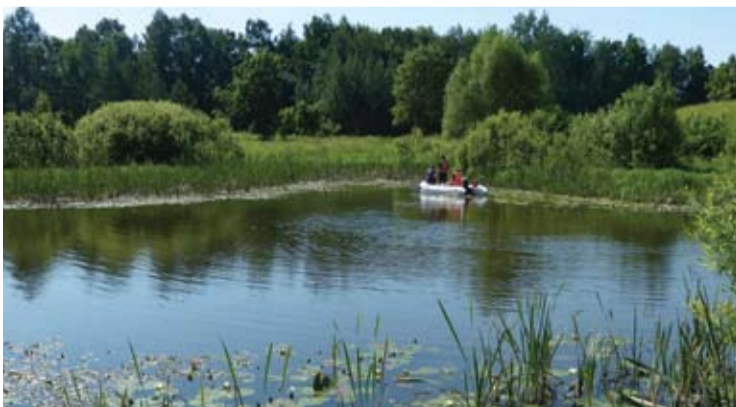
Gelbėtojai tikrino ir Antrųjų Kurklių vandens telkinius.

Visą ilgąjį savaitgalį Antrųjų Kurklių gyventojai ieškojo ketvirtadienį, birželio 23-ąją, dingusio vyro. Iki pirmadienio, birželio 27-osios, pavakario jo rasti nepavyko.