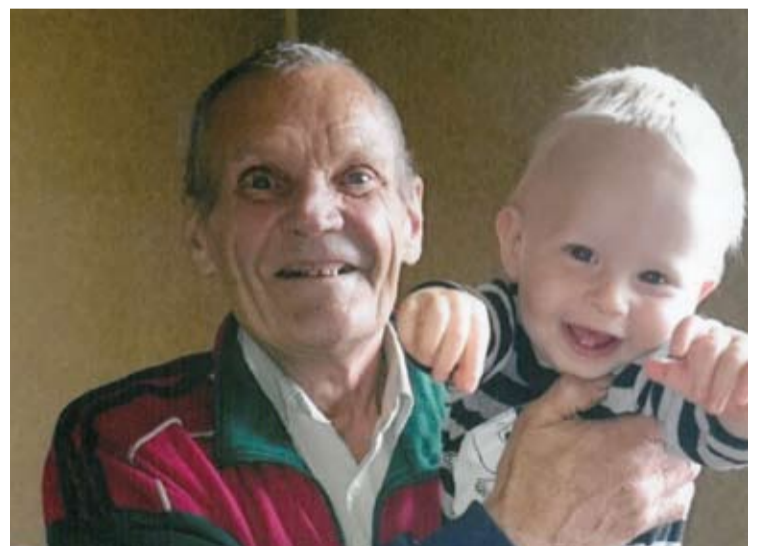
Dingęs vyras yra 78 metų amžiaus, 160-162 cm ūgio.

Policija yra paskelbusi dingusiojo paiešką. Pirmadienį gausios policininkų ir ugniagesių